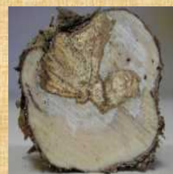
Síntomas de Yesca